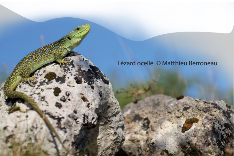
Lézard ocellé