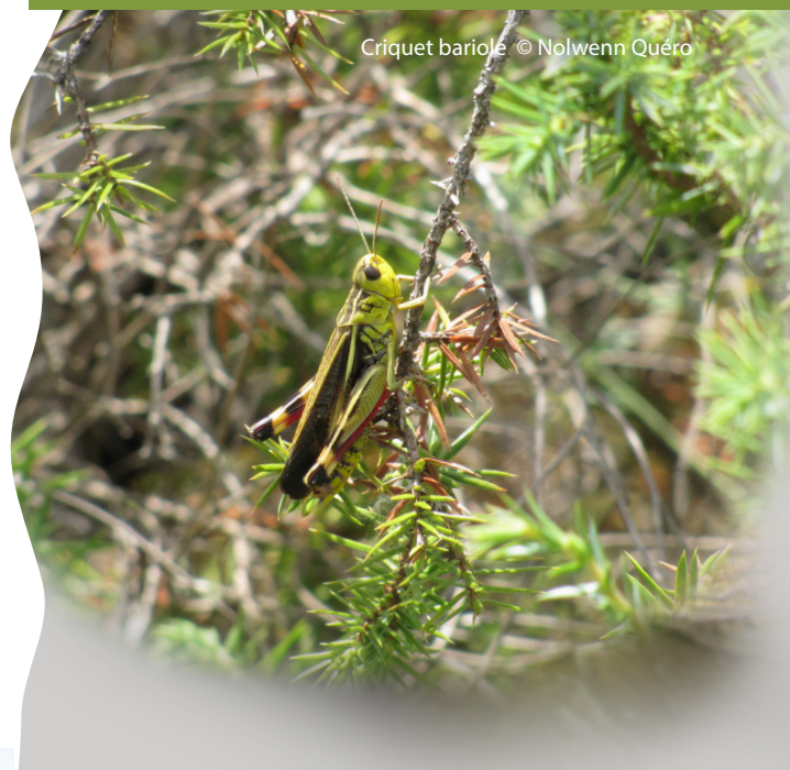
Criquet bariolé

Natura 2000 a pour vocation la conservation de ce patrimoine naturel en valorisant les usages locaux qui ont contribué au maintien de cette biodiversité.