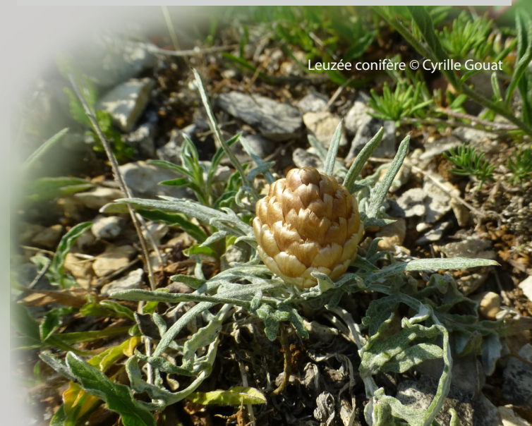
Leuzée conifère

Ainsi un pâturage par des ovins lorsqu'il est adapté permet d'éviter l'enrichissement et de conserver les milieux ouverts où les enjeux de préservation de la biodiversité sont importants.